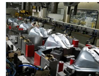
Prototypowanie i tłoczenie małych serii