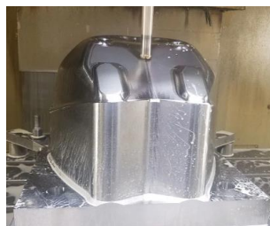
Wykonywanie indywidualnych części i zespołów