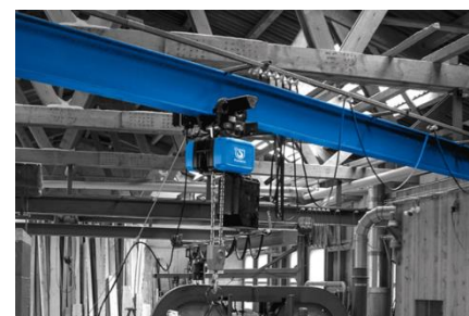
Elektryczne systemy podnoszenia