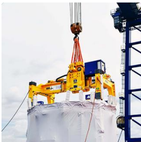
Urządzenia do obsługi ładunków na zamówienie