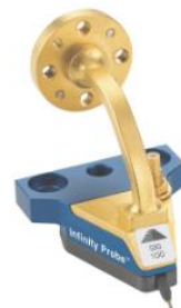
Sonda falowodowa Infinity