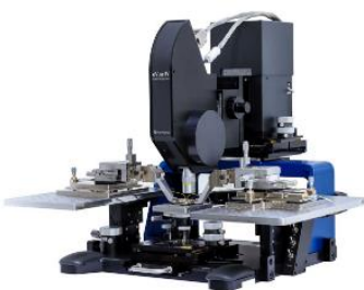
Ręczna stacja sondy do fotoniki krzemowej